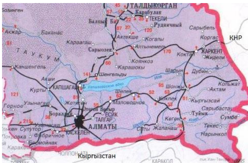
Рис. 2. Обзорная карта месторождения Туюк

Местная промышленность в районе месторождения развита слабо. Горная отрасль не получила широкого развития, хотя геологоразведочными работами выявлен ряд интересных и значительных объектов.