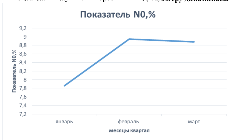
3-сурет. Есепті кезең ішінде өзгерістер кестесін құру ( N_0 )